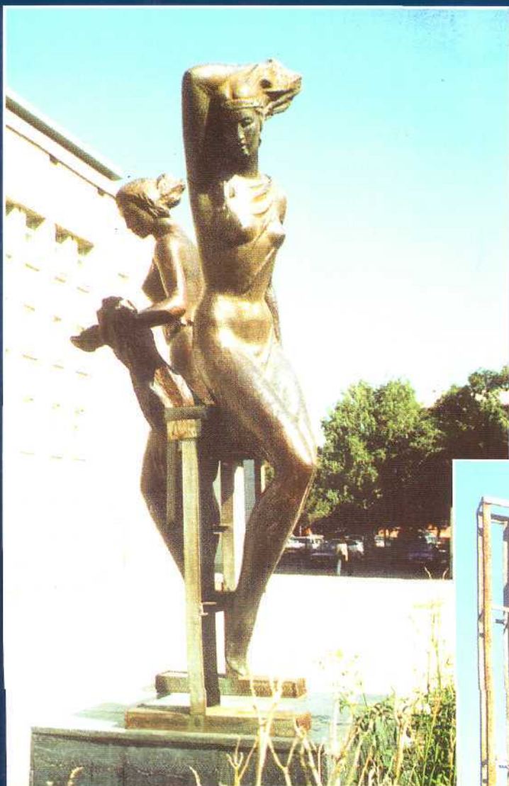
Экология, 1987–1997. Улица Красная, площадь музыкальной школы