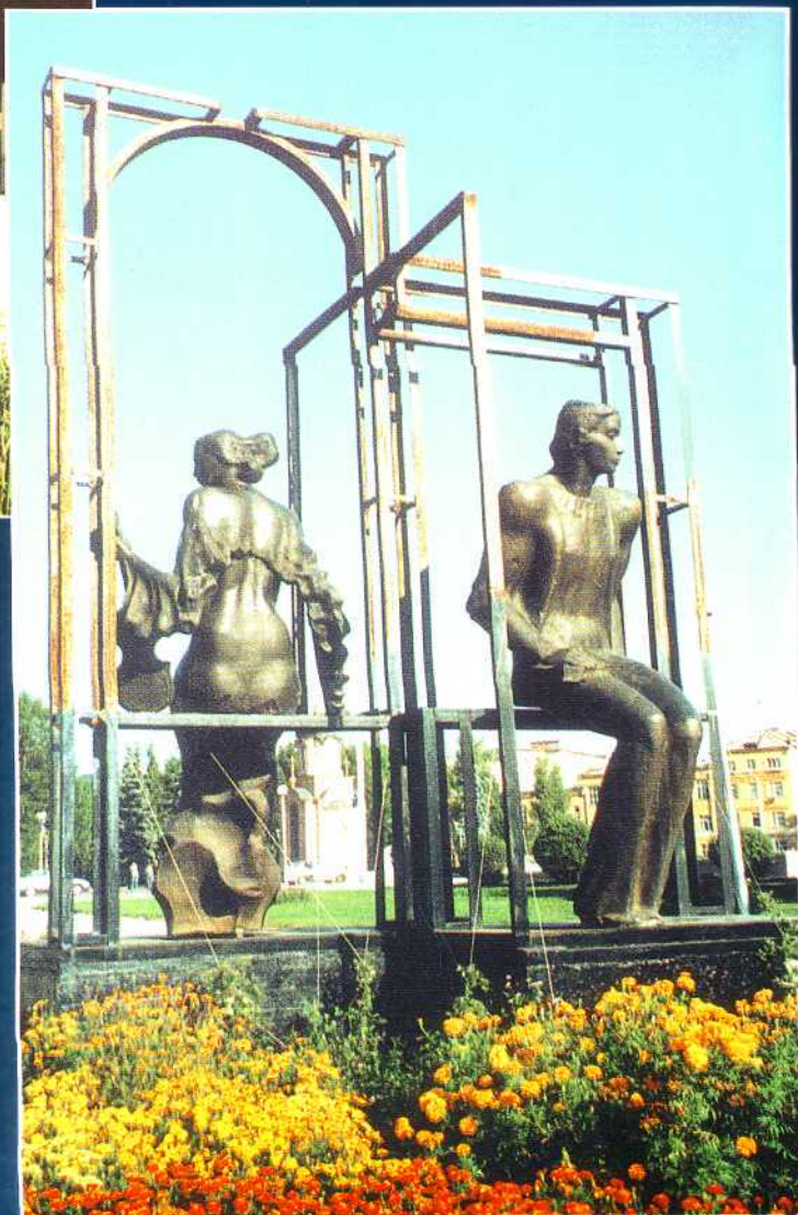
Двое в пространстве, 1985–1998. Сквер филармонии