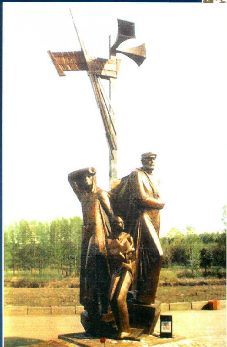
Труженикам тыла посвящается, 2005. Парк им. Г. К. Жукова