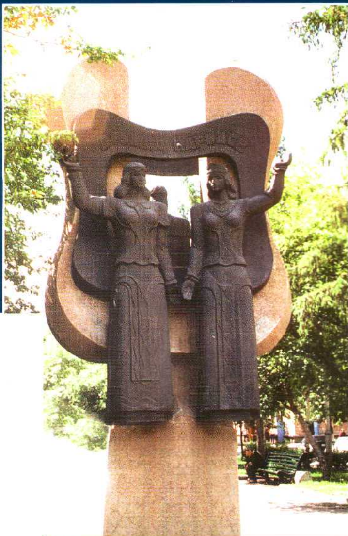
Дружба народов, 1980. Улица Весенняя